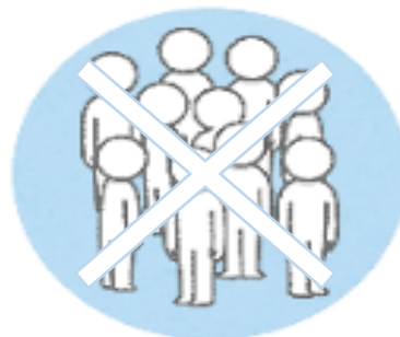
混雑時の入場制限