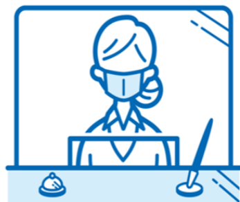
飛沫防止シートの設置