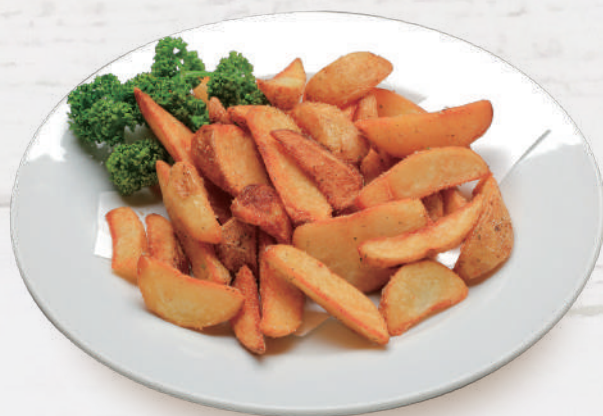
シーズニングポテト