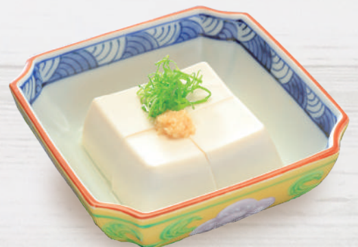
冷奴 330円 税込