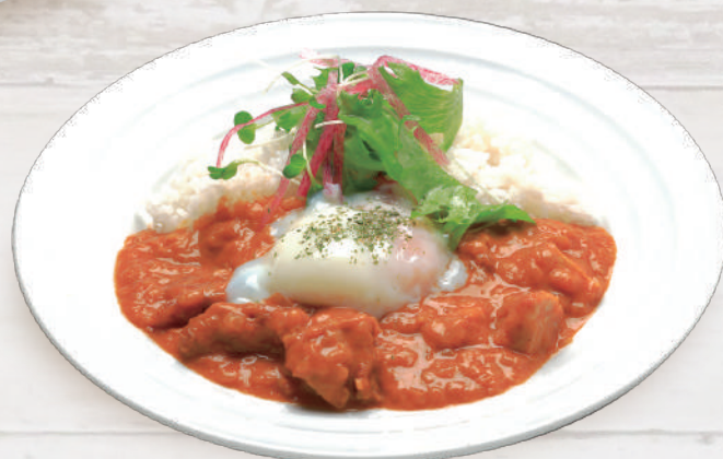
インディアンカレー (チキン) 1,320円 税込