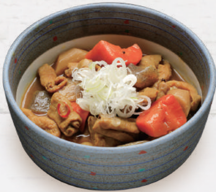
カレーもつ煮込み 770円 税込