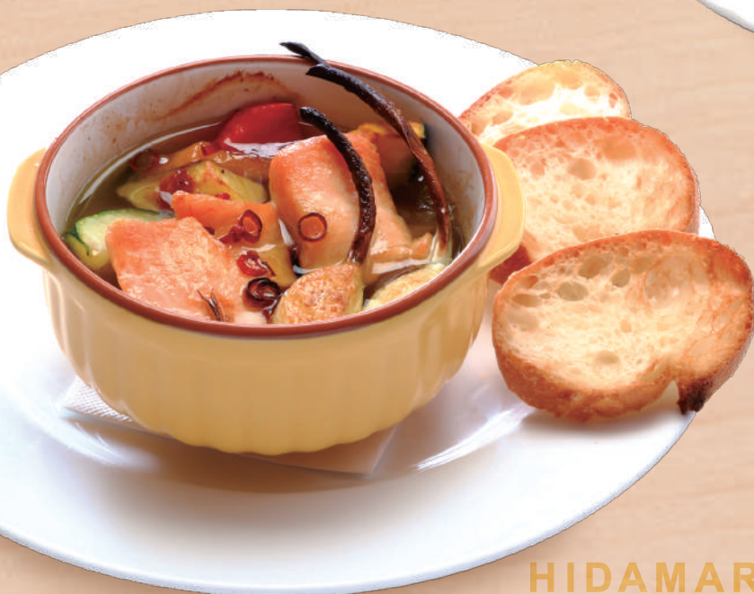
富士宮桜咲鱒のアヒージョ