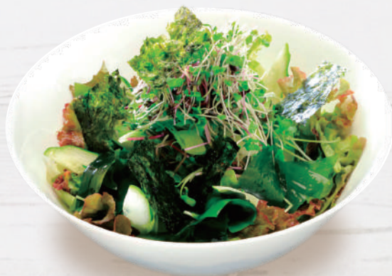
チョレギサラダ 935円 税込