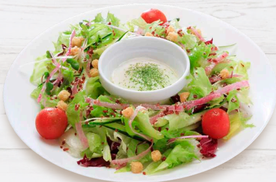
温玉シーザーサラダ 825円 税込