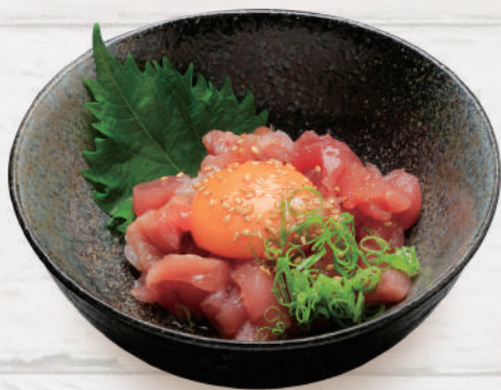
まぐろのユッケ風 660円 税込