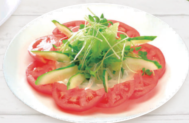
トマトサラダ 605円 税込