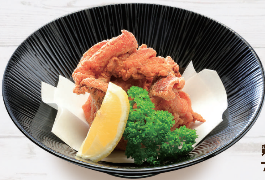
鶏の唐揚げ 715円 税込