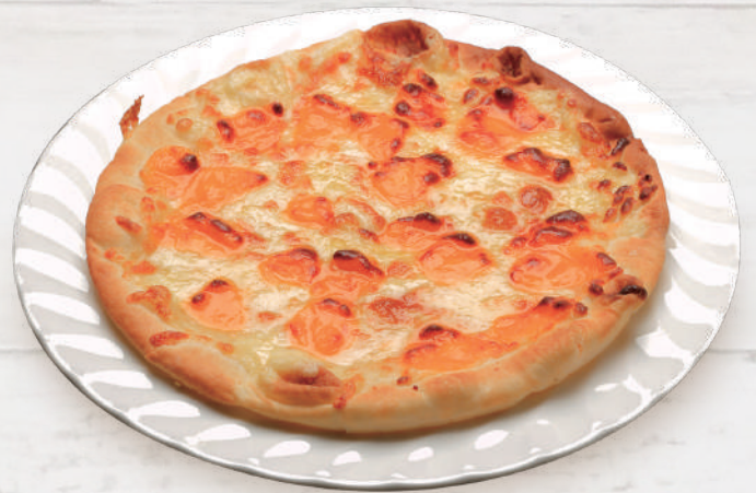
3種のチーズピザ 990円 税込