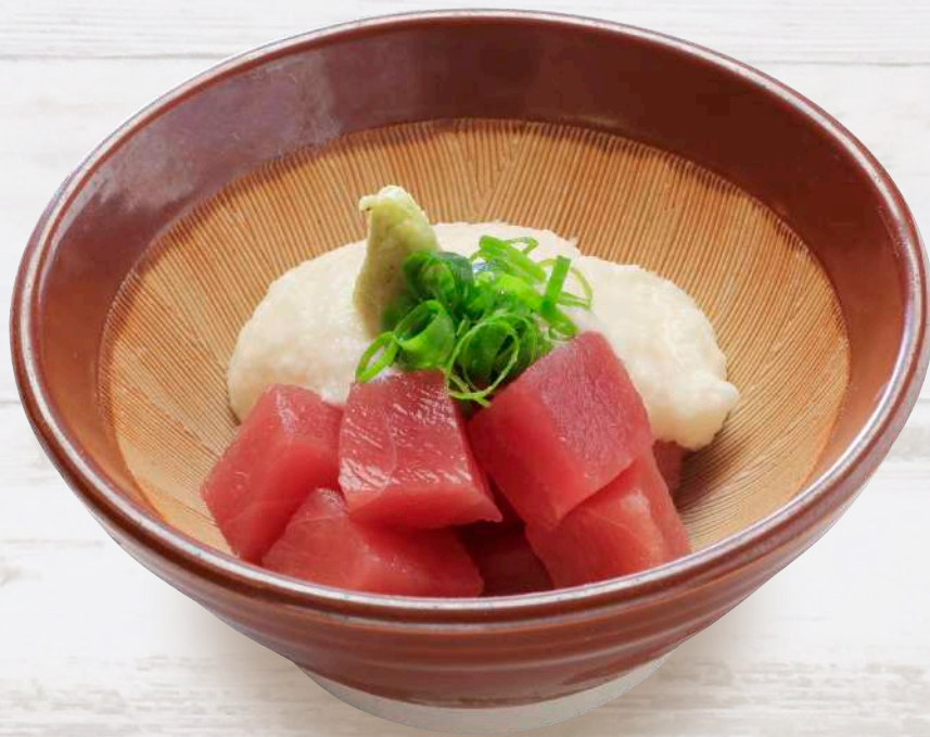
まぐろの山かけ 660円 税込