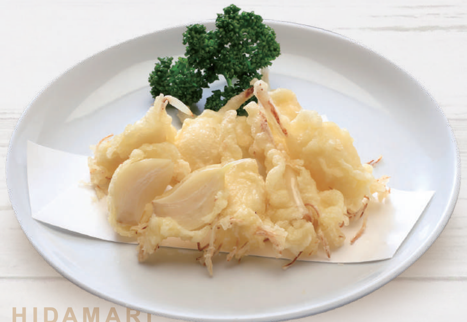
満点にんにくの天麩羅 770円 税込