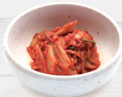
キムチ 330円 税込