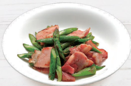
アスパラベーコン 550円 税込