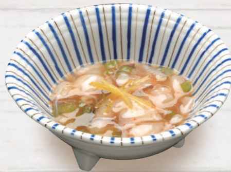
たこわさび 440円 税込