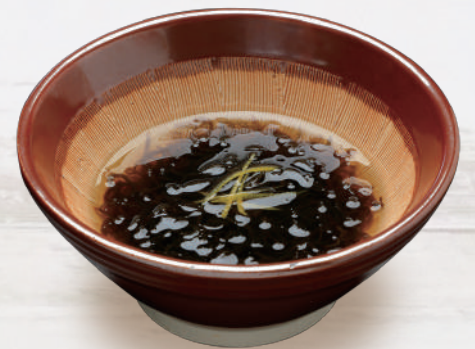
もずく酢 330円 税込