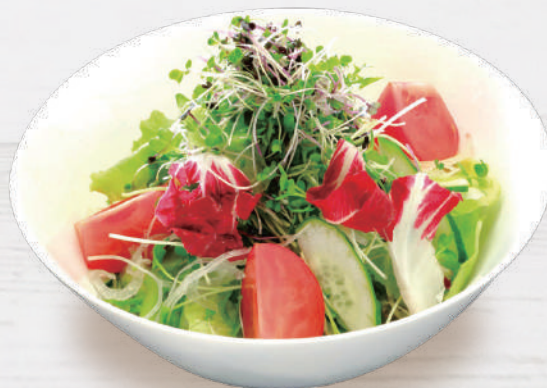
生野菜サラダ 880円 税込