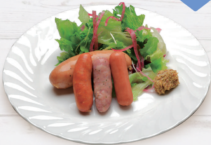
ソーセージMIX 990円 税込