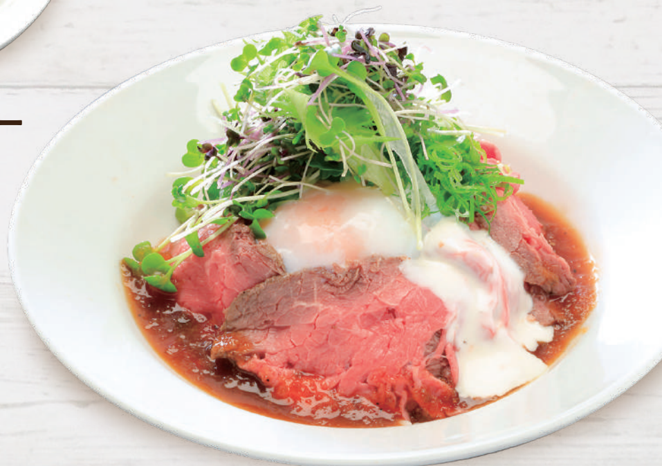
料理長自慢のローストビーフ丼 1,650円 税込