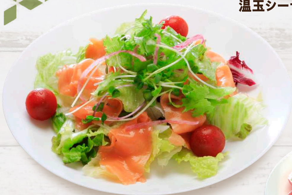
サラダスモークサーモン 990円 税込