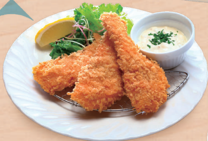
富士宮桜咲鱒のフライ