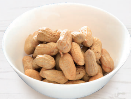
ゆで落花生 385円 税込