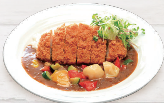
ロースカツベジタブルカレー 1,430円 税込