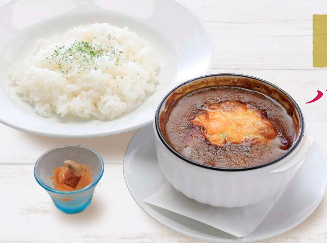
とろ〜りチーズの焼きビーフカレー 1,500円 税込