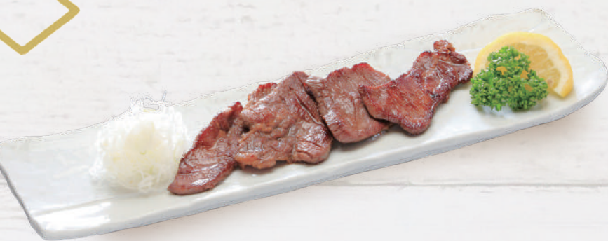
厚切り牛タンのソテー 1,650円 税込