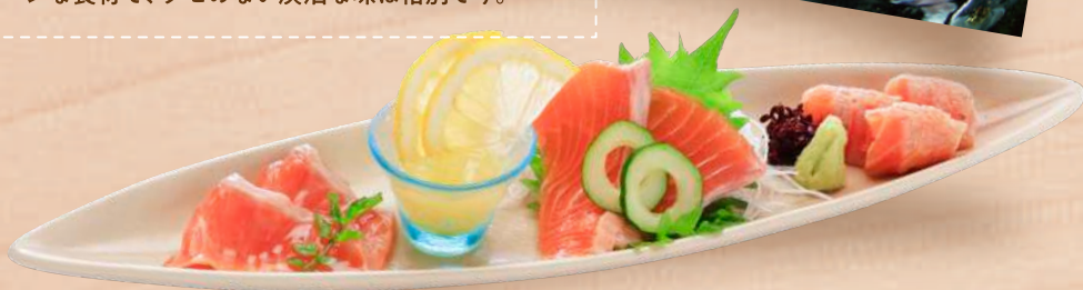
富士宮桜咲鱒3種のお造り