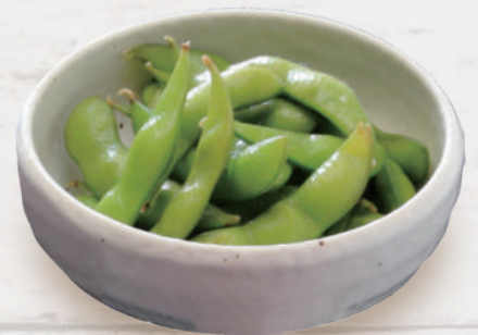
枝豆 385円 税込