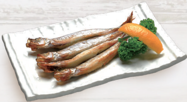
焼きししゃも 550円 税込