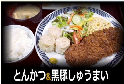
とんかつ&黒豚しゃゅうまい