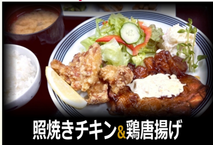
照焼きチキン&鶏唐揚げ