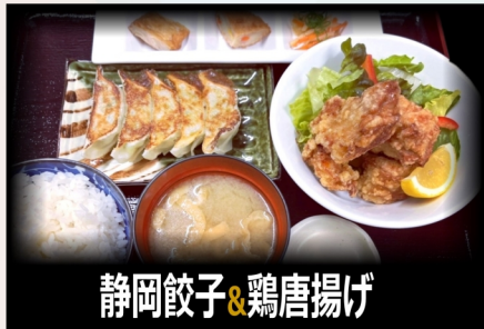
静岡餃子&鶏唐揚げ