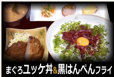
まぐろユツケ丼&黒はんぺんフライ